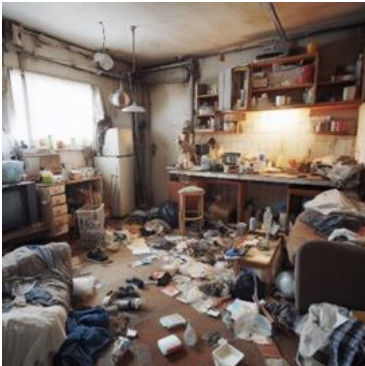
Bild 2. Exempel på ett stökigt rum. Material på alla bordsytor och på golvet, men man kan röra sig i rummet.

Utrymningsvägarna ska vara lika breda som dörren.