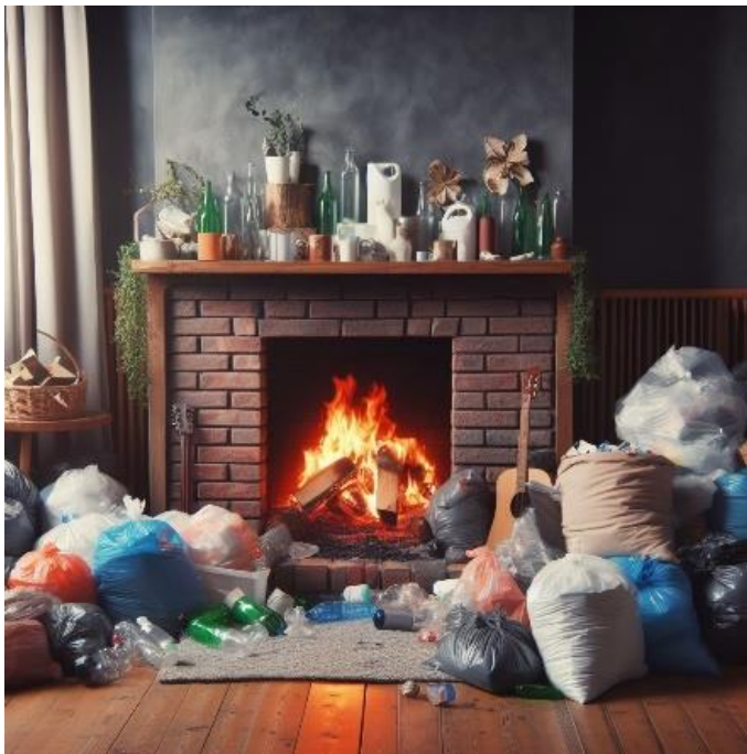
Bild 4. Exempel på en eldstad med brännbart material i närheten.

Inte heller på balkongen får man lämna levande ljus eller lyktor oövervakade, på brännbart underlag eller intill brännbart material.