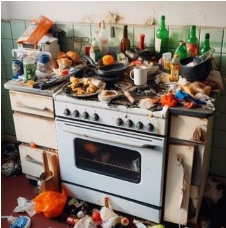
Bild 3. Exempel på en spis med brännbart material som förorsakar brandfara.

Om den boende upprepade gånger har gett upphov till risksituationer vid användning av spisen (glömt på plattorna, lämnat matlagningen oövervakad och t.ex. gått och vilat), kan spisen förses med spisvakt eller timer. I vissa fall måste man hindra spisens användning genom att stänga av dess elmatning vid bostadens säkringsskåp, eller vid behov av mera drastiska åtgärder be en elmontör koppla bort spisen från elnätet.