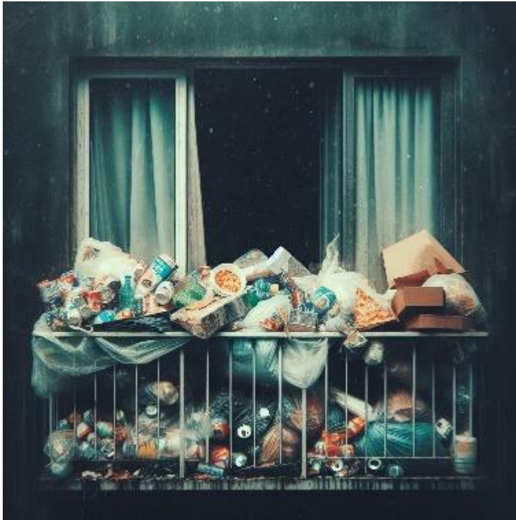
Bild 5. Exempel på en balkong, vars materialmängd förhindrar räddning via den.

Om bostaden är rökfylld, kan personerna i bostaden beordras att ta sig ut på balkongen. Därför får inte material förvaras på balkongen i sådan mängd att man inte kan utrymma bostaden via balkongen och räddas därifrån. En stor materialmängd på balkongen utgör också en brandbelastning.