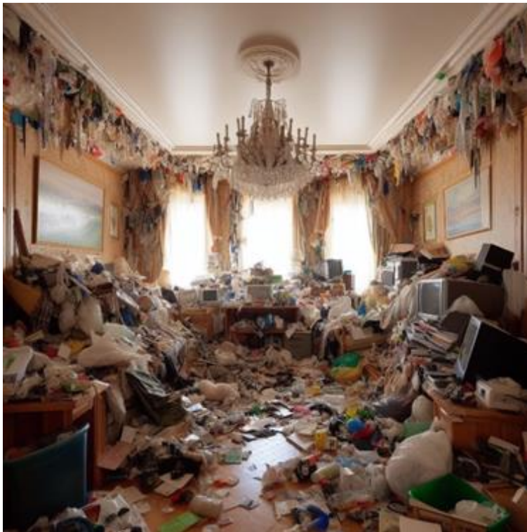
Bild 1. Exempel på rum med stor materialmängd.