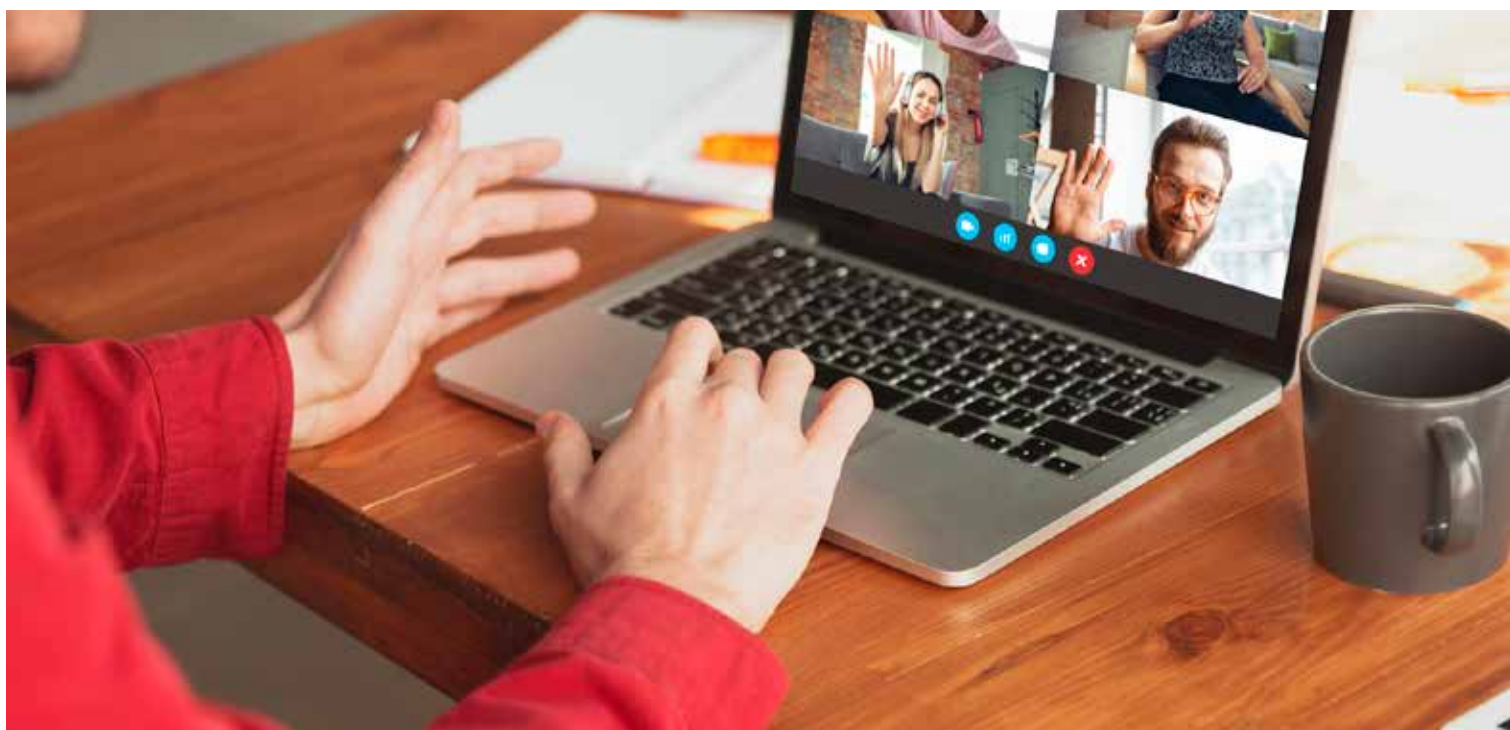
Kuvassa ihminen tietokoneen äärellä Teams palaverissa.