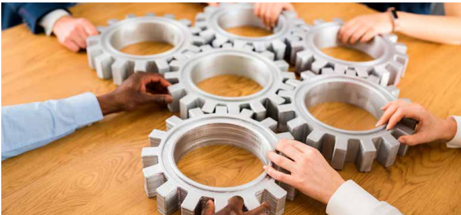
Kuvassa ihmisiä yhteistyössä pöydän äärellä.