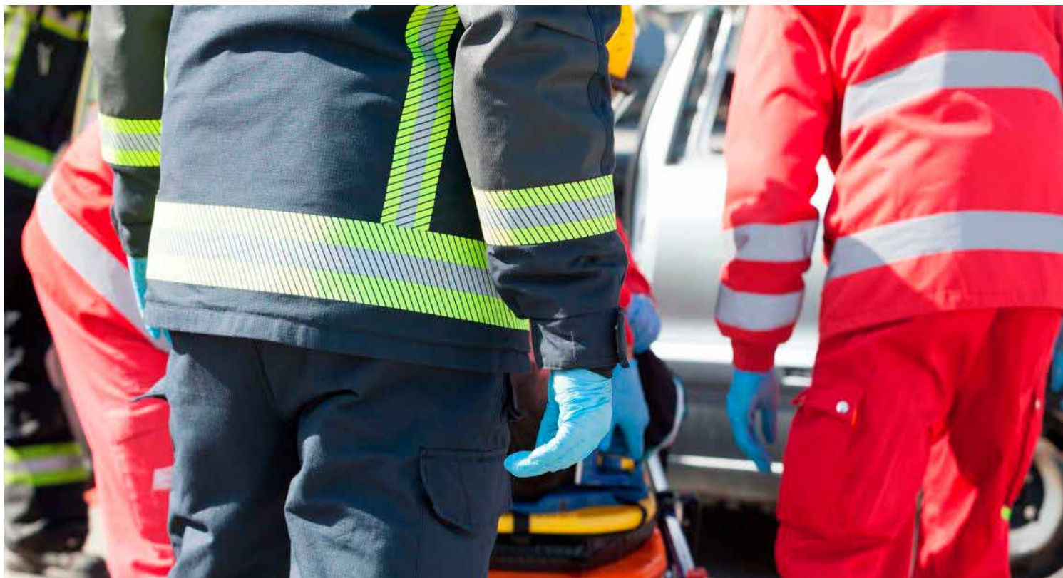
Kuvassa ensihoitajat siirtävät poltilasta ajoneuvosta pelastajien kanssa..

..... ”Palvelualueen yhteyteen on esitetty perustettavaksi työturvallisuus työryhmä, jonka tehtävänä on kehittää mm. uhka- ja väkivaltilanteiden koulutusta ja tilastointia.”