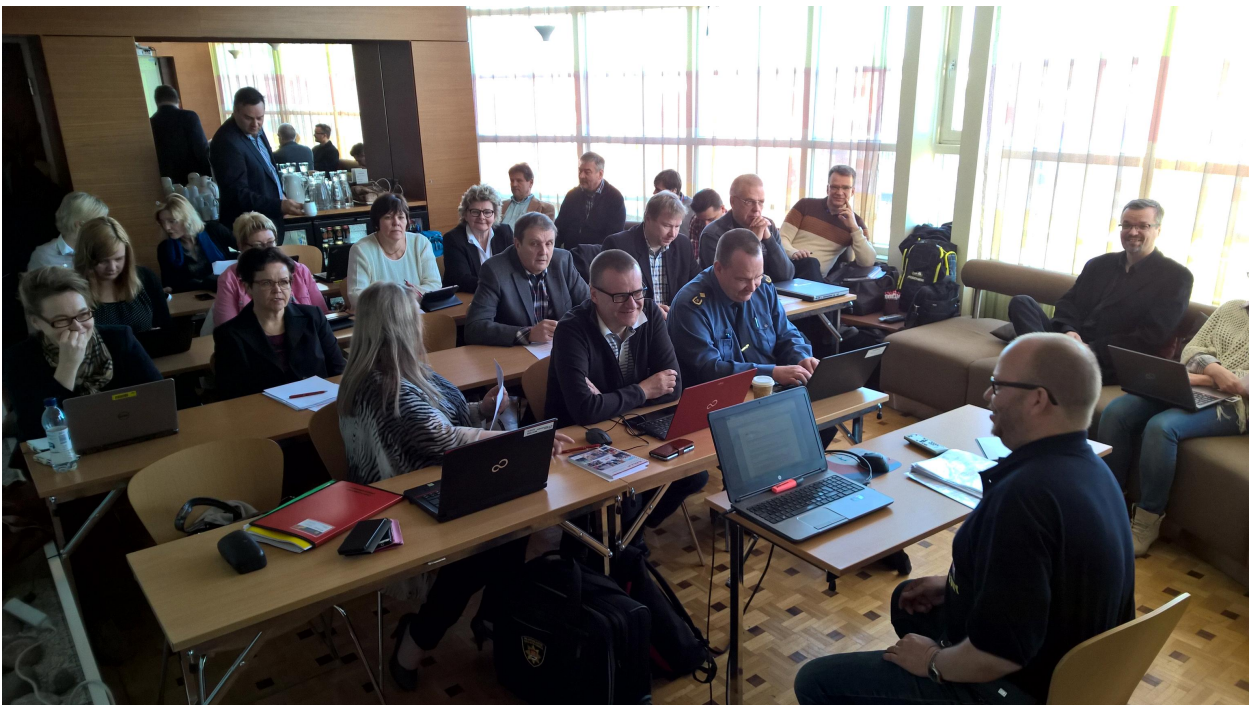
Kuva tukipalveluiden kokouksesta Vantaalta huhtikuulta.